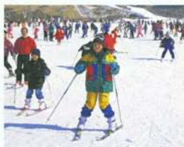
ウインタースポーツ▶